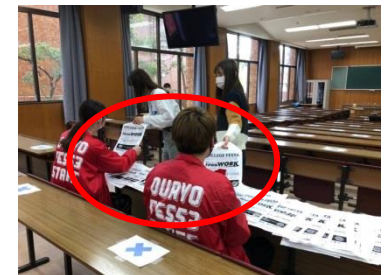
※来場者が配布物を取る写真が必要です。

※上図の様に、配布スタッフさんと受取るお客様のいろんな角度からが写り、ロゴが見える方向から撮影すると、とてもキレイに撮影できます。