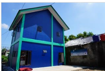
ホテル清掃研修センター