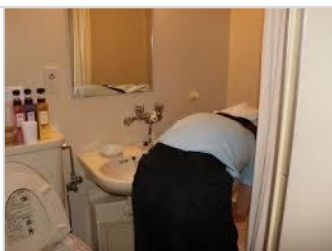
バス・トイレメイク④