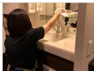
バス・トイレメイク③